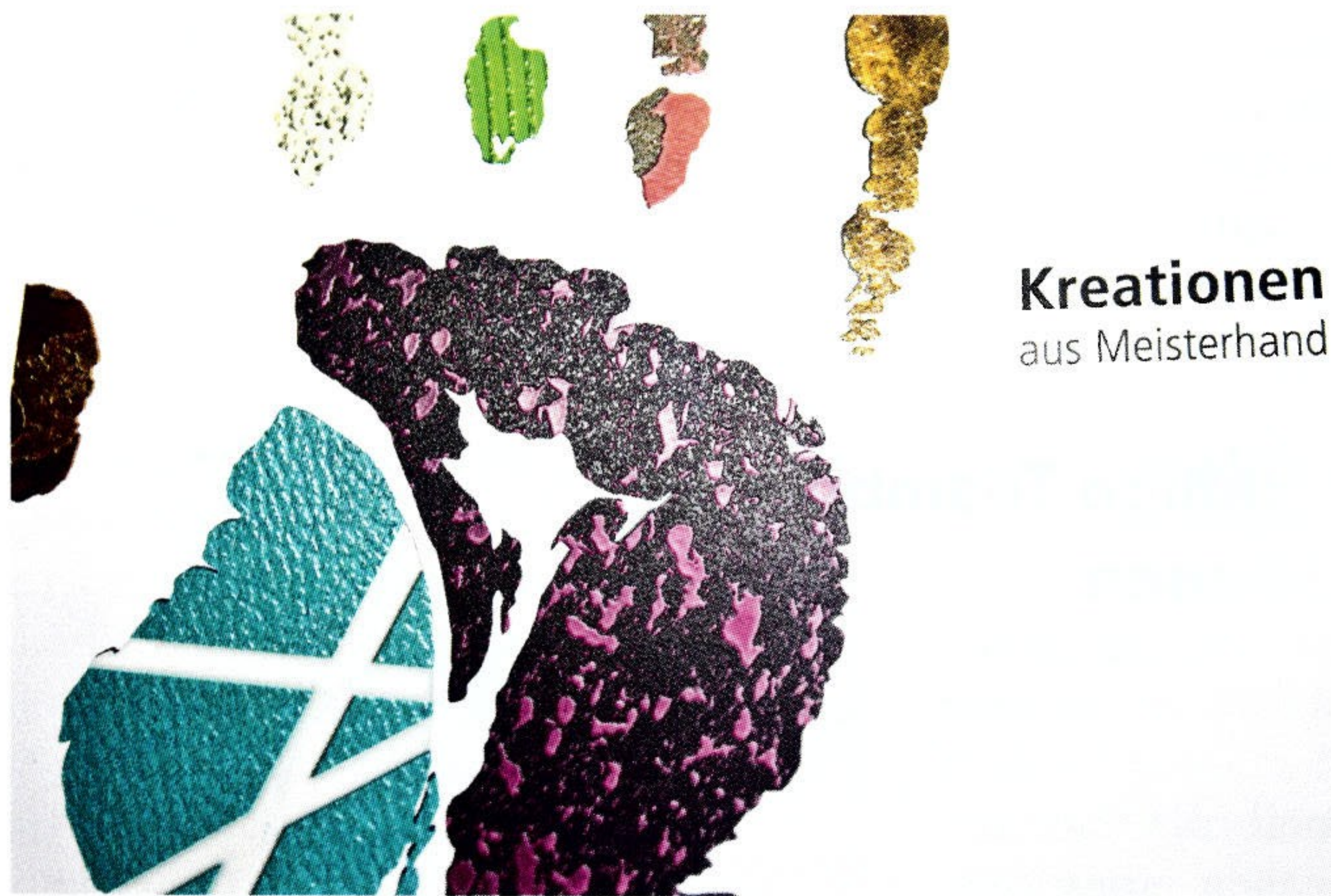
Kreationen aus Meisterhand

Image-Broschur über Design-Putzsysteme: Unterschiedliche Strukturierungen und Schichten machen dieses Produkt zu einer Besonderheit.